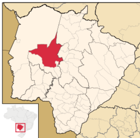
Figura 3: Localização do município de Aquidauana.

Atualmente, segundo dados da Prefeitura Municipal de Aquidauana 4 , as atividades relacionadas à indústria, serviços e agropecuária são a base da economia do município. Na agricultura, atualmente, a cidade possui uma área de lavoura temporária de 9.492 ha onde se destaca o cultivo de milho, mandioca e olerícolas. O mesmo acontece na pecuária, com destaque para a de corte, em uma área de 949.694 ha de pastagem natural, e 810.790 cabeças de bovinos, segundo dados do Instituto Brasileiro de Geografia e Estatística – IBGE 5 .