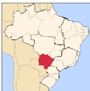
Figura 1 - Localização de Mato Grosso do Sul

Conforme Censo Demográfico de 2010, a população residente no estado correspondia a 2.449.024 habitantes, sendo 2.097.238 pessoas residentes na área urbana e 351.786 na área rural 3 . Com uma área de 357.145,532 km 2 , composta por 4 mesorregiões, 11 microrregiões e 79 municípios, o estado é ligeiramente maior que a Alemanha.